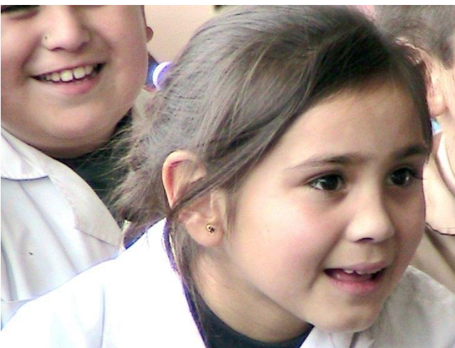
Figura 4: Niños observan el cortometraje

Así, unidades didácticas creadas con el modelo I-D-E-A-L fueron presentadas y evaluadas en 2 regiones, en espacios rurales y urbanos, con clases pequeñas y numerosas, para la educación general básica. A pesar de hacer falta una evaluación por un agente externo al equipo implementador de las unidades existentes, desde la subjetiva percepción de sus creadores, se aprendieron valiosas lecciones e identificaron obstáculos y oportunidades que se detallan a continuación.