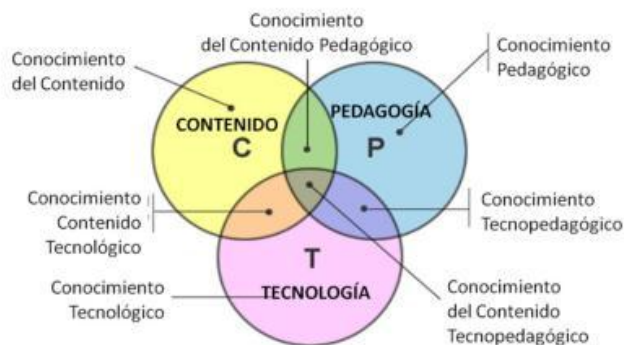
Figura 1: Modelo TPCK para la Creación de Unidades Didácticas Digitales.

En este modelo se establece que por una parte se necesita la colaboración del experto en TIC para elegir y programar los aspectos de informática; una segunda área de conocimientos y capacidades la tiene el experto educador el que aportaría con la capacidad pedagógica; en tanto que el tercer ámbito es aportado por el experto en la disciplina vinculada a la asignatura.