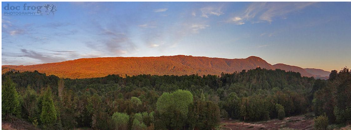
Parque Katalapi, Foto de César Barrio-Amorós/doc frog